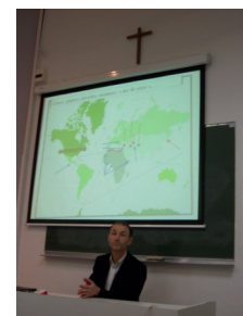
De plus en plus les écrans prennent de la place dans nos débats. Ils permettent souvent de mieux expliquer les enjeux (ici lors du rendez-vous du forum Cathocité).

2013 à Strasbourg, Paris et Lyon. Et en 2014, pourquoi pas Lille-Bruxelles, Paris et Bordeaux ? Les Semaines Sociales du futur doivent aussi mieux prendre en compte le besoin de formation pour mieux diffuser la pensée sociale de l'église. C'est certainement là l'autre enjeu majeur de ces Semaines Sociales qui se conjuguent au futur !